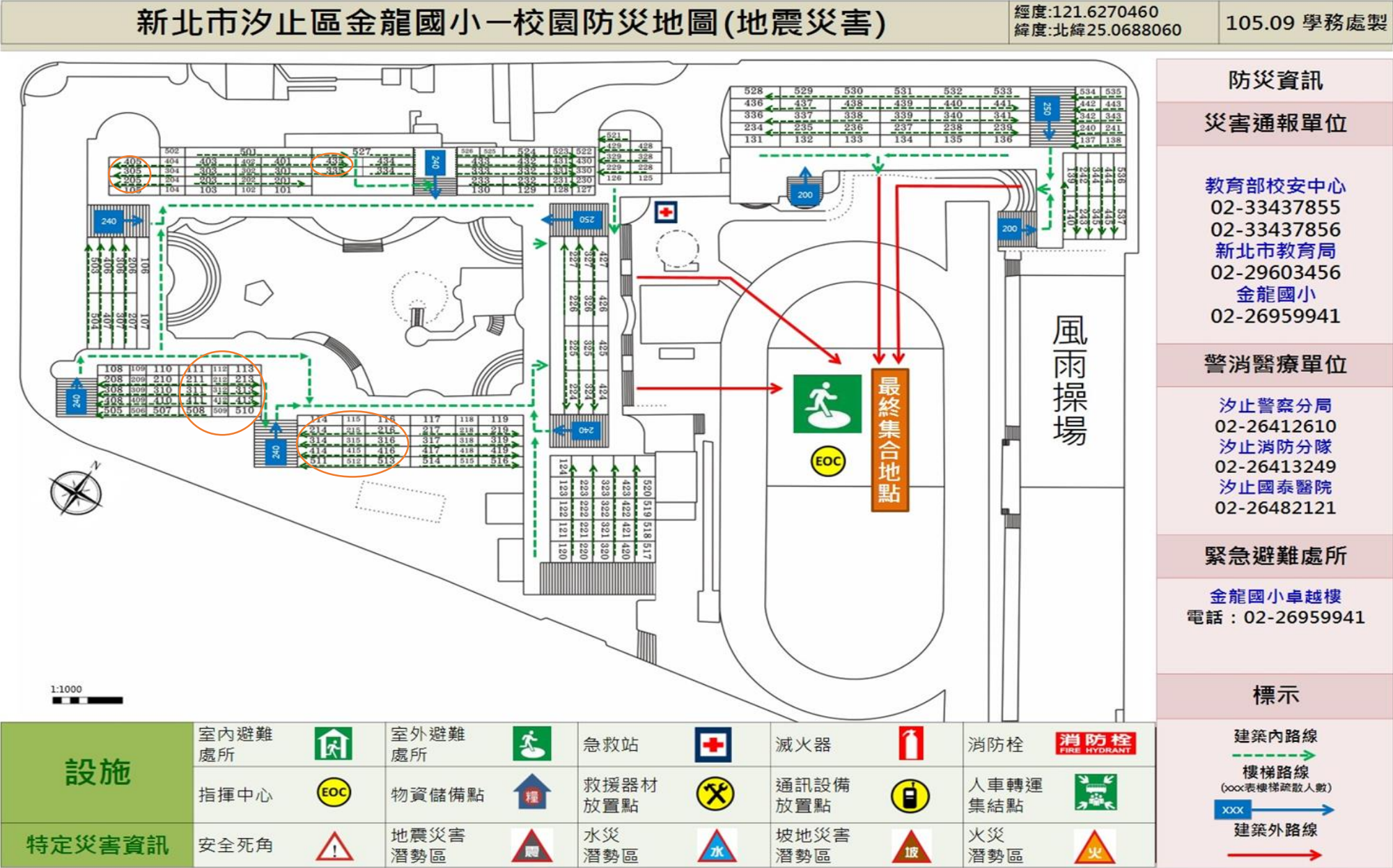
柒、新北市金龍國小 105 學年度逃生疏散動線圖